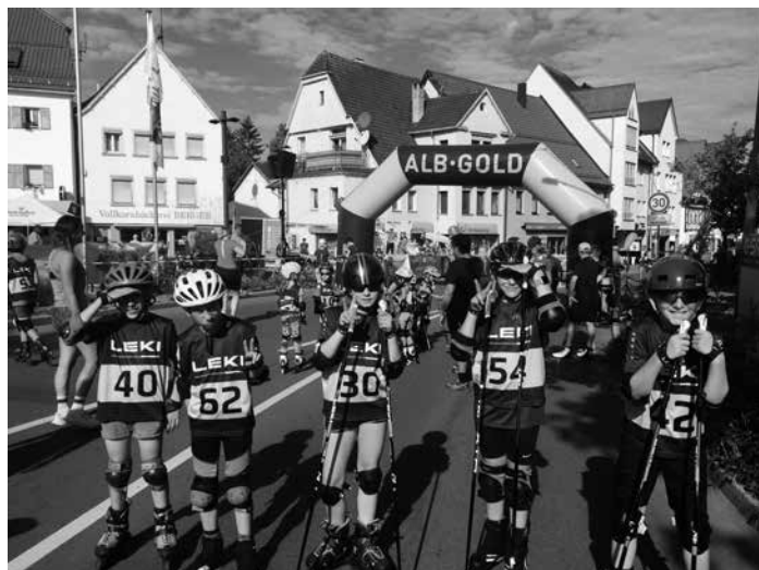
Viel Spaß hatte der Läufer Nachwuch beim Pfullinger Citysprint auf der Schwäbischen Alb

Nicht minder erfolgreich verlief die Wettkampfreise in den Südschwarzwald. Bei herrlichem Spätsommerwetter pilgerten am vergangenen Sonntag, 24.09.2023, rund 200 Läuferinnen und Läufer aus dem gesamten Verbandsgebiet ins Glottertal, wo der Ski-Club St. Peter seinen schon traditionellen Geländelauf ausgerichtet. Die Konkurrenz war für viele im Feld von doppelter Bedeutung, denn die Platzierungen finden auch in diesem Jahr in der sog. SV-Cup-Wertung Berücksichtigung. Hoch motiviert und bestens vorbereitet gingen sieben Akteure des Skiteams Bad Peterstal-Griesbach -krankheitsbedingt mussten zwei Aktive leider absagen- ins Rennen und am Ende kehrten sie allesamt mit tollen Platzierungen und guter Punktausbeute wieder ins Renchtal zurück.