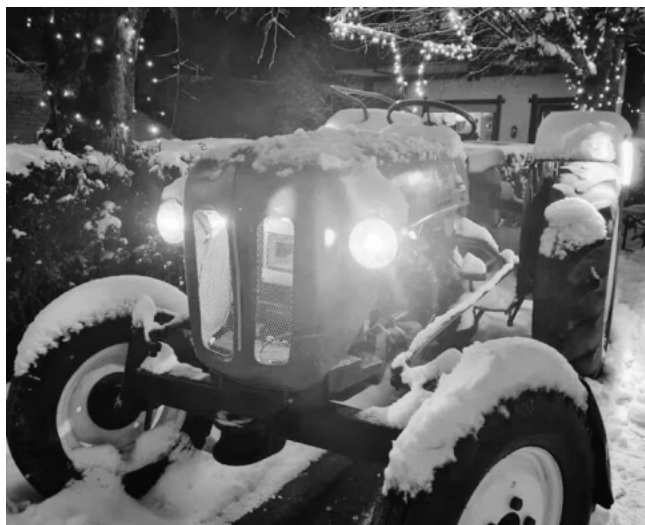
Christmas Party am Palmspring