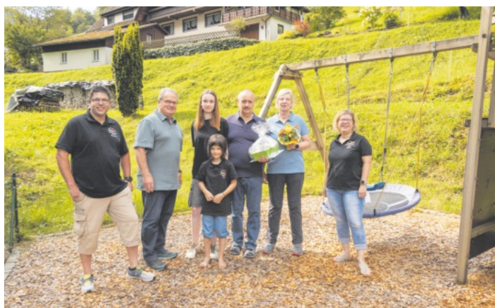
Das Ehepaar Leithmann von Heddeshheim wird für ihre 10-jährige Treue zu Bad-Peterstal geehrt.

E-Mail: boschert.petra@bad-peterstal-griesbach.info