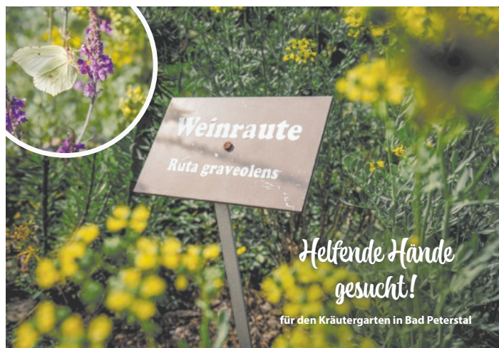
Kräutergarten Kurpark Bad Peterstal