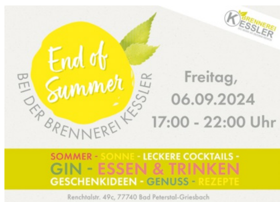
End of Summer