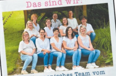
Ein ökumenisches Team vom oberen Renchtal.