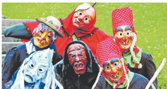
Narrenzünfte Bad Peterstal-Griesbach

Veranstalter: Ilwedritsche Bad Peterstal e.V.