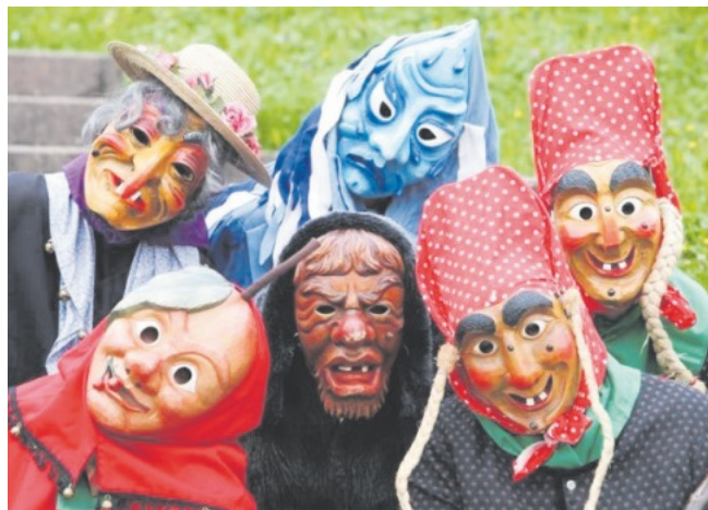
Narrenzünfte Bad Peterstal-Griesbach