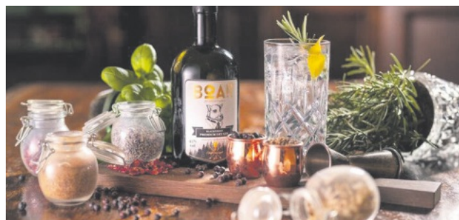
Boar Gin Tasting