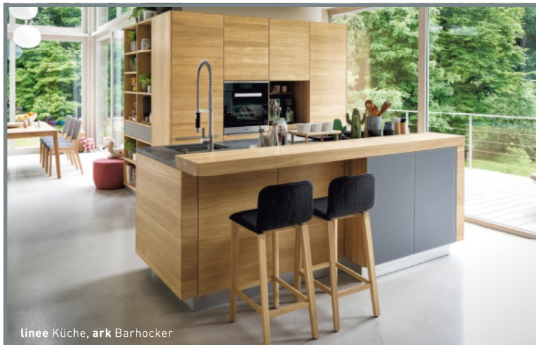
linee Küche, ark Barhocker