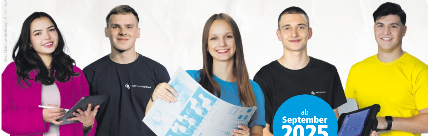
Fotos: Christoph Bierbaupf, Grafik: Nadzeya Polkhorova/stock.adobe.com

Mechatroniker m/w/d Medientechnologe Druck m/w/d