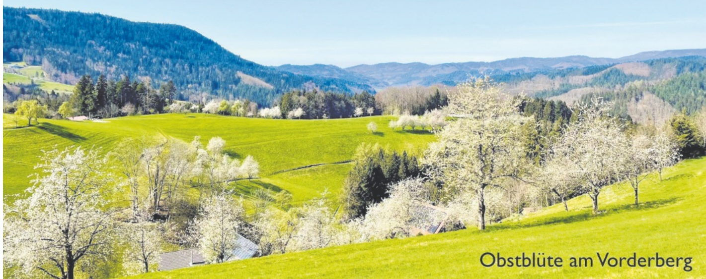
Obstblüte am Vorderberg

Herausgeber und Verleger: Gemeinde Bad Peterstal-Griesbach Verantwortlich für den amtlichen Teil: Bürgermeister Meinrad Baumann o.V.i.A.