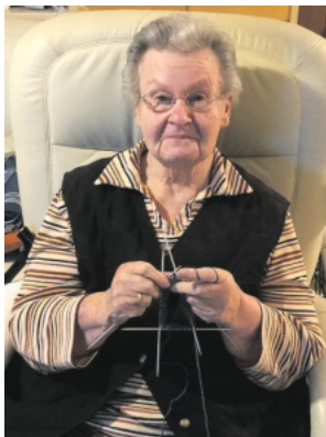
Bad Peterstal, im Januar 2026

Die große Wertschätzung hat uns tief bewegt und macht uns sehr dankbar.