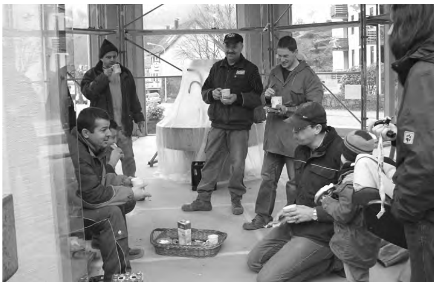
"Richtfest" - das Gerüst steht!