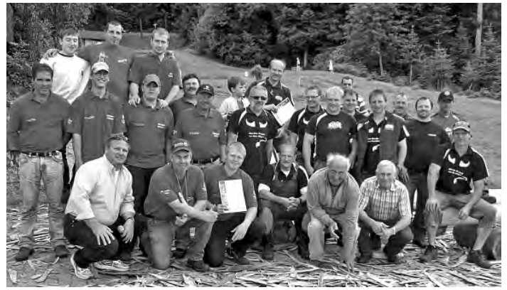
Die Teilnehmer des 5. Schwarzwälder Vierkampfs kamen ganz schön ins Schwitzen. Sie mussten auf dem Löcherhansenhof mähen, räpeln, melken und sägen.

Neben landwirtschaftlichem Geschick und Teamgeist war von den teilnehmenden Gruppen vor allem auch Schlagfertigkeit gefragt, denn der Spaß stand an erster Stelle. So klang der Tag mit einem gemütlichen Beisammensein aus. Für die Bewirtung sorgten der örtliche Landfrauenverein und Familie Huber vom Löcherhansenhof.